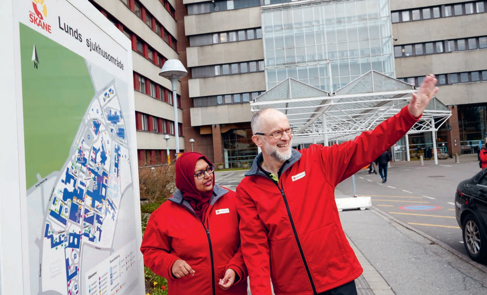
→ Rödakorsvårdarna vid sjukhusen i Göteborg, Lund, Malmö, Helsingborg, Växjö och Örebro ger stöd och informerar om coronaviruset.