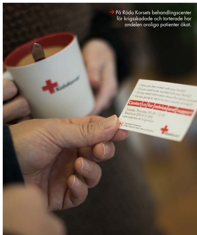
→ På Röda Korsets behandlingscenter för krigsskadade och torterade har andelen oroliga patienter ökat.

trygghet, samhörighet, tillit och hopp genom telefonen. Alla som svarar i stödtelefonen är utbildade i psykologisk första hjälpen och vana att möta människor i utsatta situationer. Syftet har inte varit att göra medicinska bedömningar – den typen av samtal hänvisas vidare till exempelvis 1177 Vårdguiden.